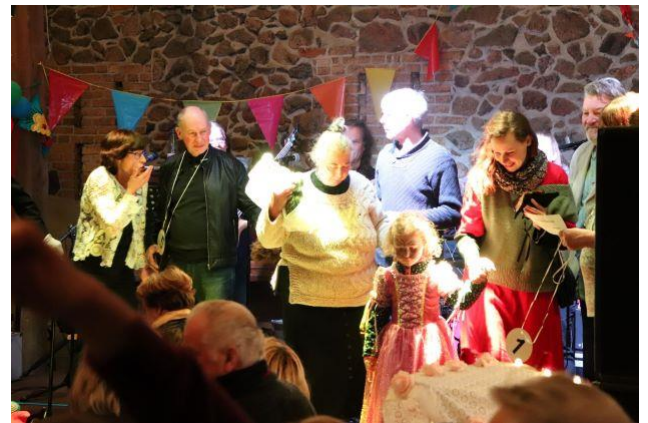
Frank Schöbel und Fans